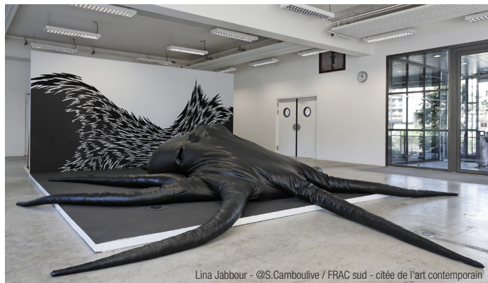
Lina Jabbour - @S.Camboulive / FRAC sud - citée de l'art contemporain