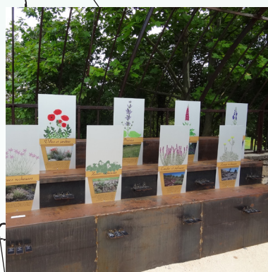
4/ La Serre