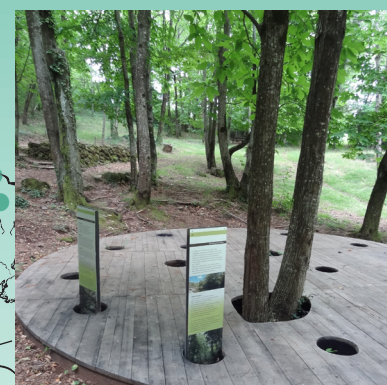
9 / La châtaigneraie