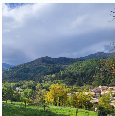
2 / Point de vue sur Jaujac village de caractère