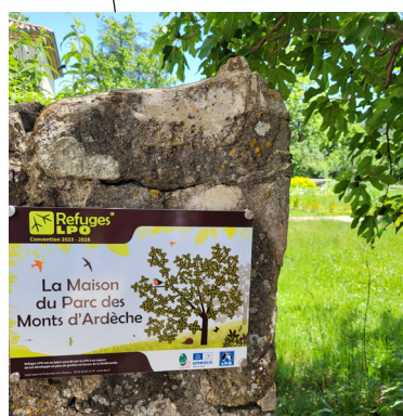
3 / Les jardins refuge LPO