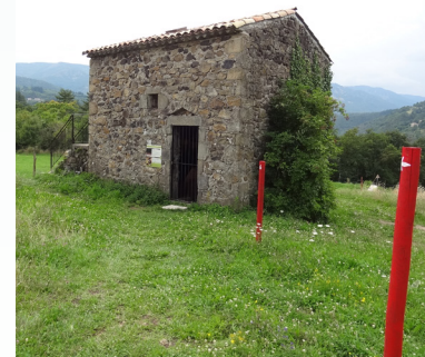
6 / La clède