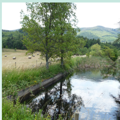
5 / Le bassin de biodiversité