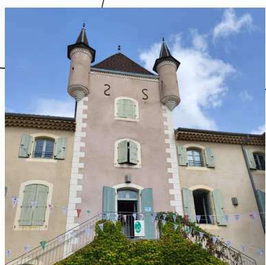
1 / Entrée de la Maison du Parc