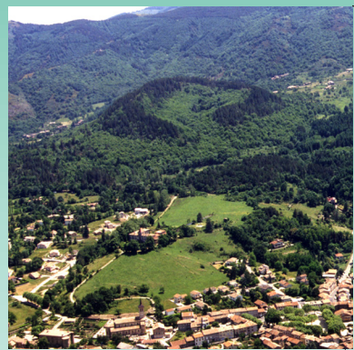
11/ Volcan de Jaujac