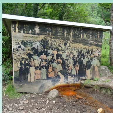
10 / La source