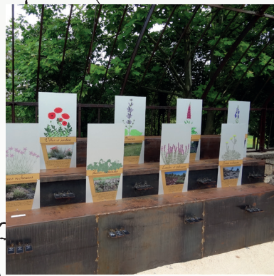
4/ La Serre