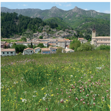
2 / Jaujac, village de caractère

Vers le parking et Jaujac, Accès piéton uniquement sauf personne à mobilité réduite