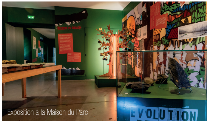
Exposition à la Maison du Parc

Au sein de ce domaine, vous serez accueillis pendant l'été et les vacances d'automne et de printemps à la Maison du Parc et découvrirez des expositions originales, un espace information et librairie, un bar à eaux et une boutique.