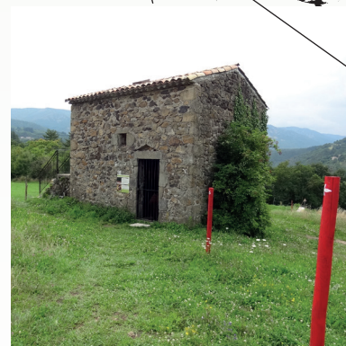
6 / La cléde