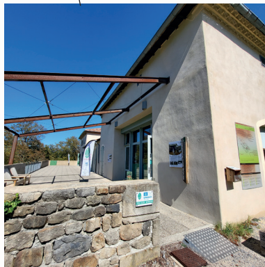
1 / Entrée de la Maison du Parc