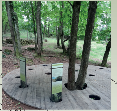
9 / La châtaigneraie