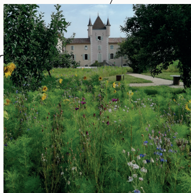
3 / Les jardins