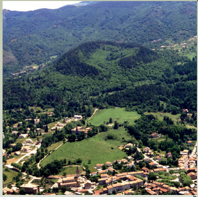
11/ Volcan de Jaujac