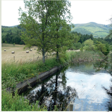
5 / Le bassin de biodiversité