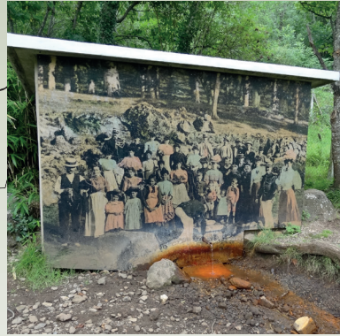
10 / La source