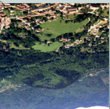
11 / Volcan de Jaujac