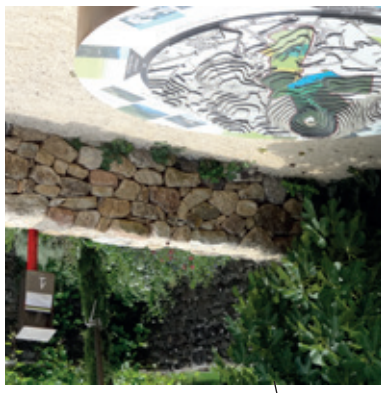
1 / Le Rochemuroscope