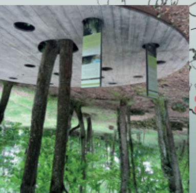
9 / La forêt

#007missionpollen Sillonnez les jardins de la maison du Parc et le sentier d'interprétation pour aider la bande des pollinisateurs, conduite par James Bourdon, à remplir leur mission : sauver la biodiversité. Feuillet-jeu disponible à la Maison du Parc pendant les horaires d'ouverture. Lots à gagner. Gratuit, pour toute la famille