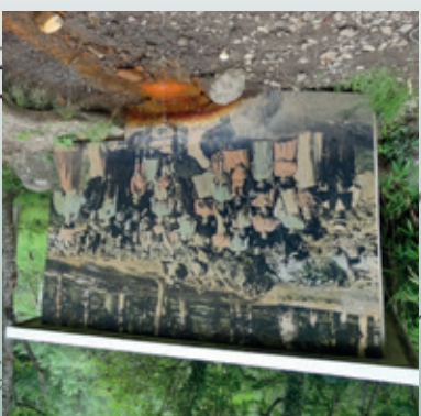
10 / La source