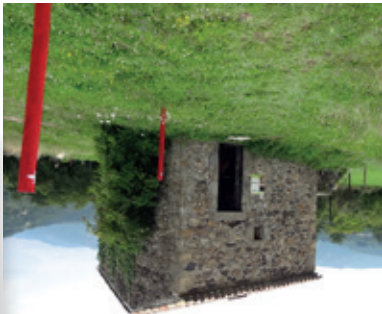
6 / La cléde