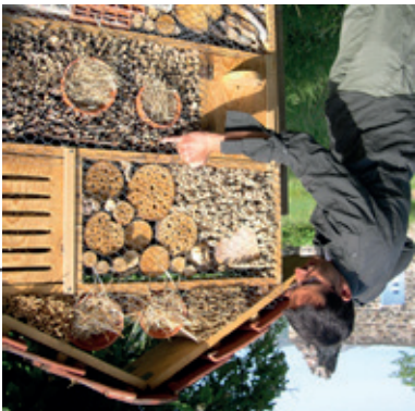
3 / Hôtel à insectes