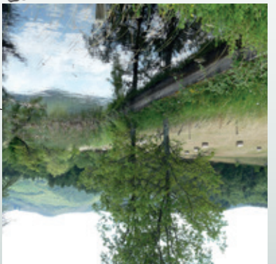
5 / Bassin de biodiversité