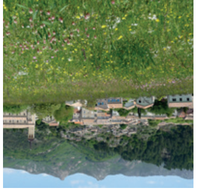
Jaujac, village de caractère