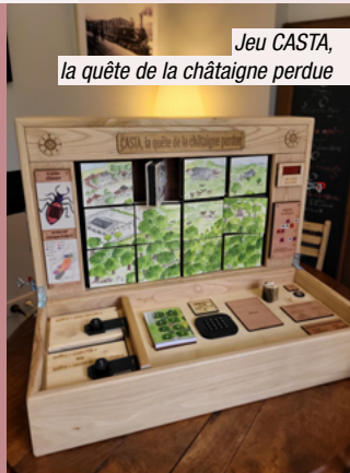
Jeu CASTA, la quête de la châtaigne perdue