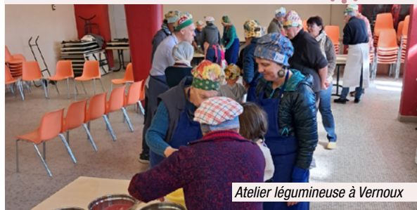
Atelier légumineuse à Vernoux