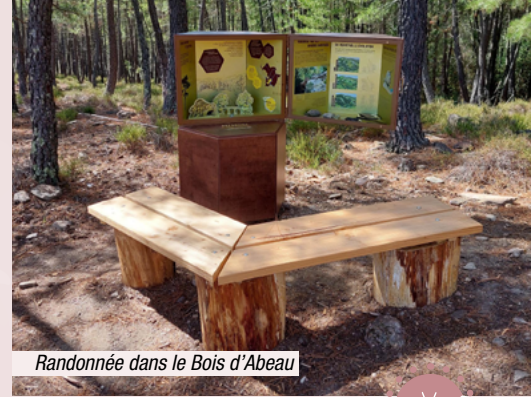
Randonnée dans le Bois d'Abeau