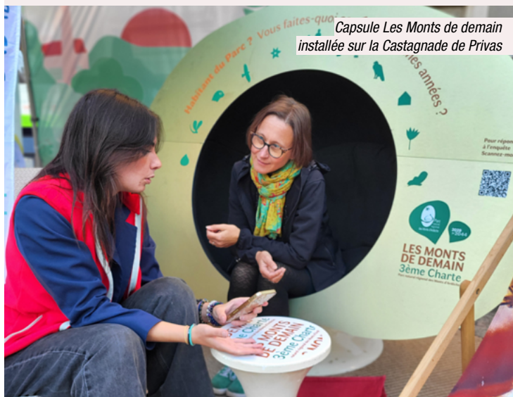
Capsule Les Monts de demain installée sur la Castagnade de Privas