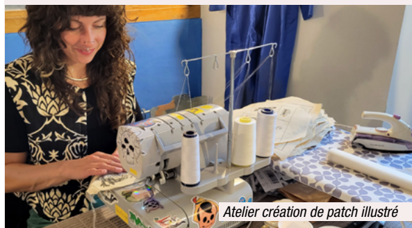
Atelier création de patch illustré