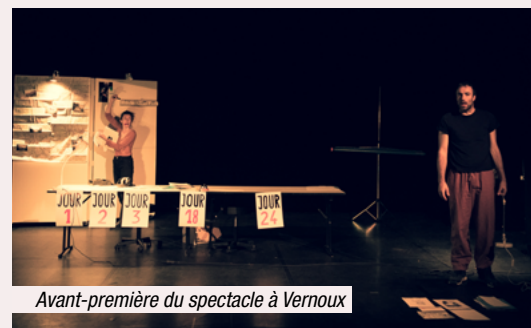
Avant-première du spectacle à Vernoux

► Toutes les dates à découvrir sur l'agenda en ligne du Parc.