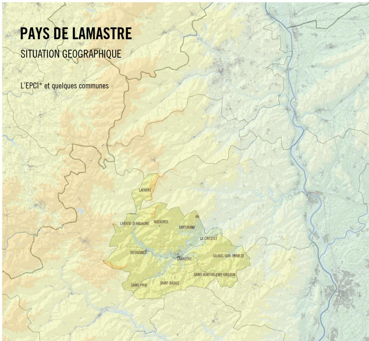
Carte de la CdC dans le Parc, avec le nom des communes