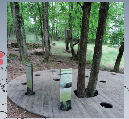
9 / La forêt