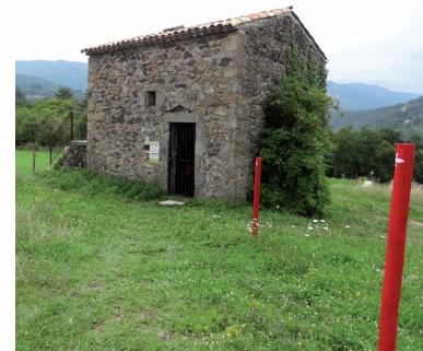
6 / La clède