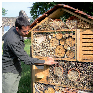
3 / Hôtel à insectes