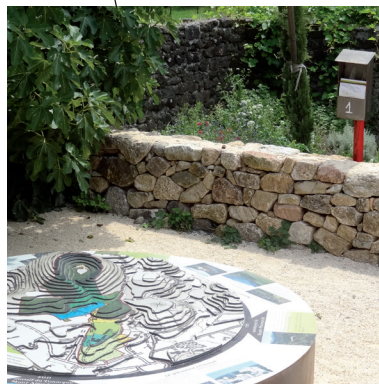
1 / Le Rochemuroscope