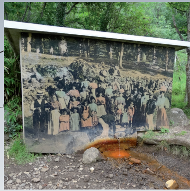
10 / La source